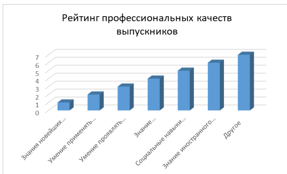
Рисунок 1. Рейтинг профессиональных качеств выпускников